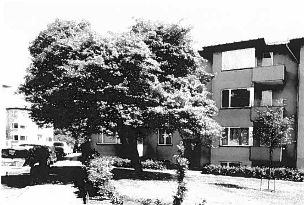
En fuldvoksen hanesporetjørn i Strandparken med afgørende betydning for oplevelsen.

Det er Fællesudvalget (FU), et udvalg bestående af repræsentanter fra de 13 ejerforeninger, 2 andelsforeninger og lejerne, der er ansvarlig for forvaltning og drift og som er et forum hvor emner af fælles interesse drøftes.