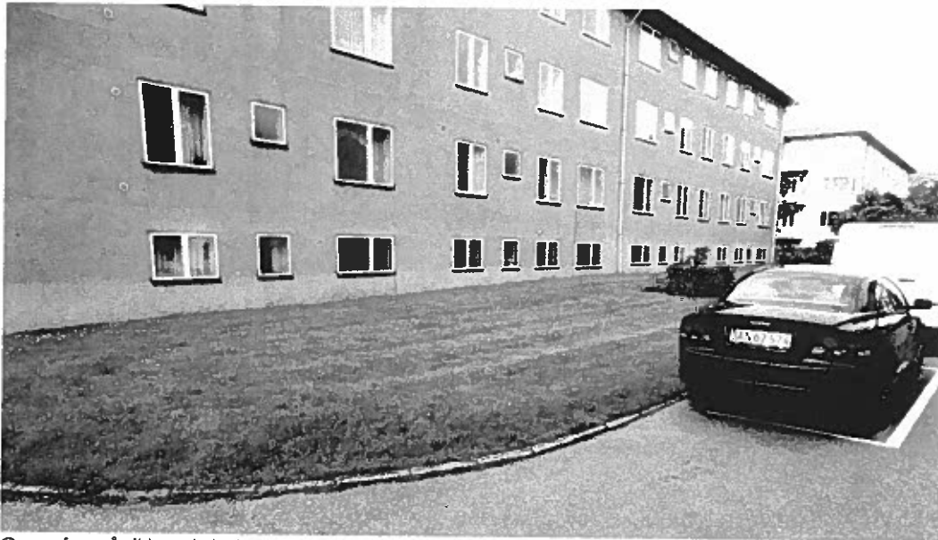
Græs formår ikke at skabe rum eller give oplevelser. Der er ikke meget liv at se på - og naturen har ringe kår.